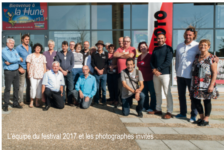
L'équipe du festival 2017 et les photographes invités